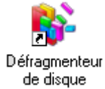
Défragmenteur de disque

Les systèmes Windows voient leurs fichiers s'éparpiller sur le disque dur. Ils se retrouvent en petit morceaux.